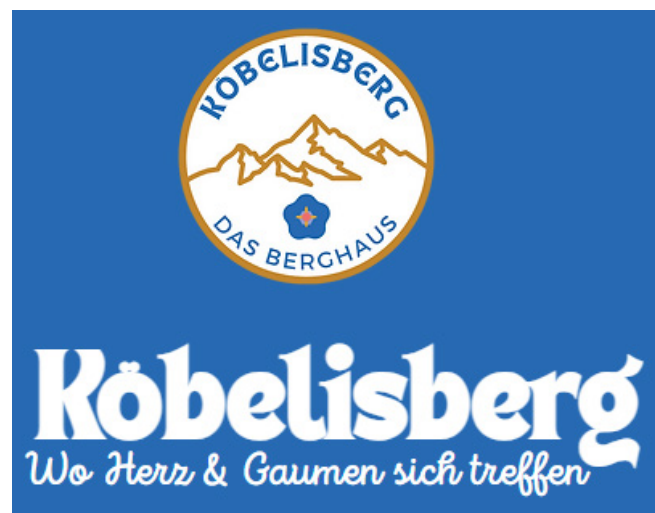
Ausschnitt aus der neuen "Köbeli"-Website