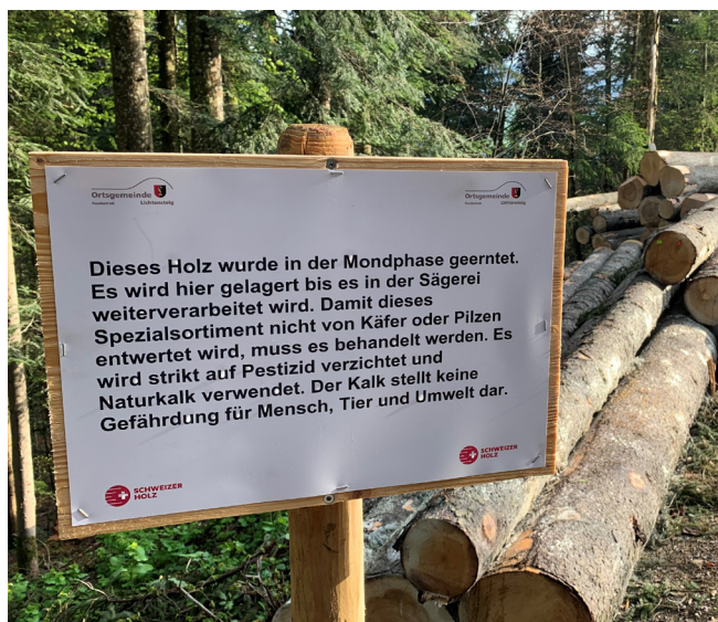
Mondholz-Lager in der Brandenhütte