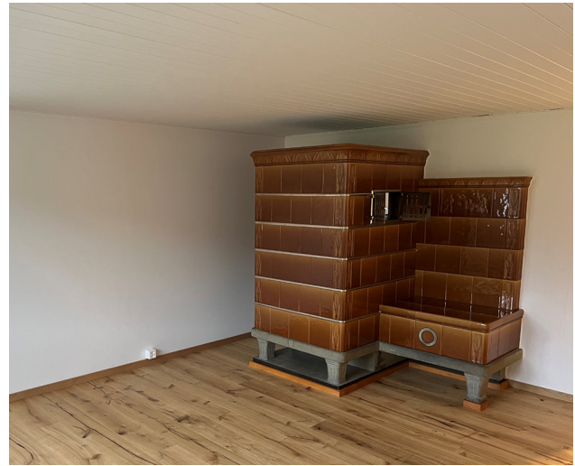
Wohnzimmer mit Kachelofen, Wohnhaus "Sack"

Für die Wirth'sche Familienstiftung Regula Kündig