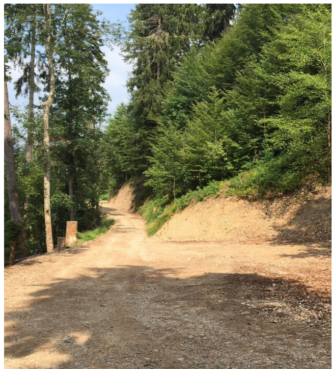
Bewirtschaftungsstrasse im Brandenwald

Im Jahr 2023 sind weniger Fahrbewilligungen für die Köbelisbergstrasse als üblich ausgestellt worden (6180/42401). Die budgetierten Kantonsbeiträge (6180/46310) für die im Jahr 2022 durchgeführten Unterhaltsarbeiten an der Hüttenwaldstrasse sind im Jahr 2023 noch nicht eingetroffen und werden im 2024 erwartet.